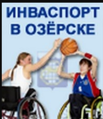
Информационный портал «Инваспорт Озёрска»