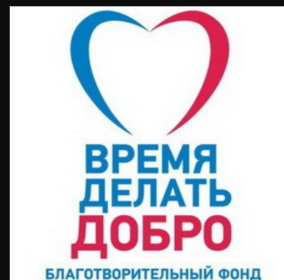
Благотворительный фонд «Время делась добро»